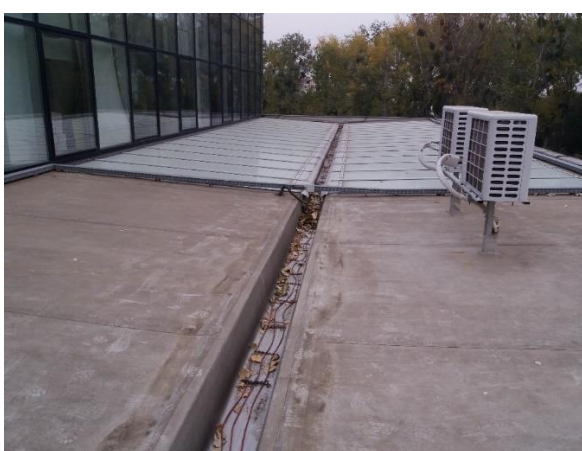
Slika 8. Izgled krova