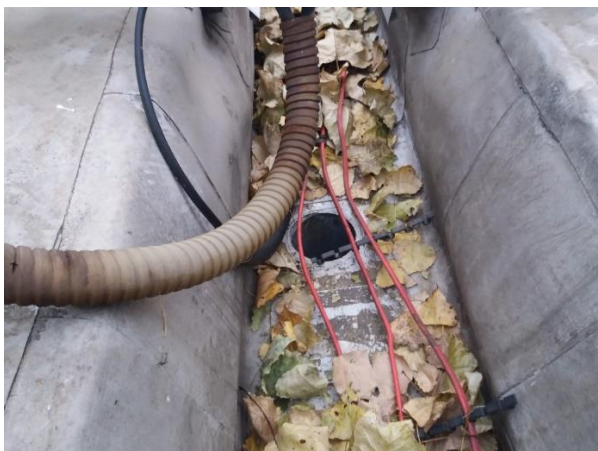
Slika 7. Oluk i slivnik na krovu

Kao rezervno rešenje predlaže se ugradnja monofazne muljne pumpe u horizontalni ležeći okluk sa crevom kao odvodom van krovne ravni preko fasade objekta, kao ispomoć u slučaju pojave velikih kiša, a napajanje pumpe može da se izvede sa napajanja postojećih klima spoljašnjih jedinica na krovu neposredno pored slivnika.