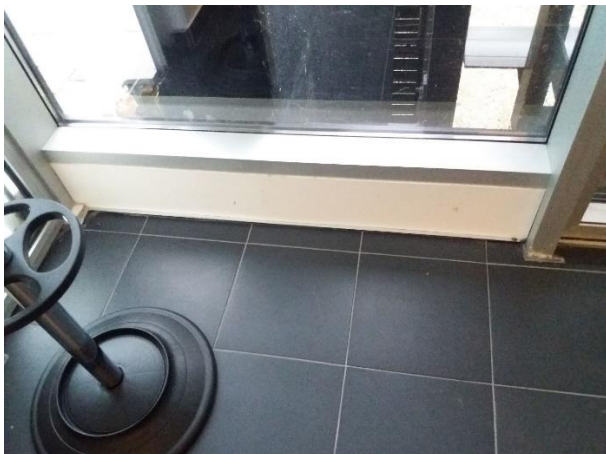
Slika 9. Parapet ispod fasade za prodor