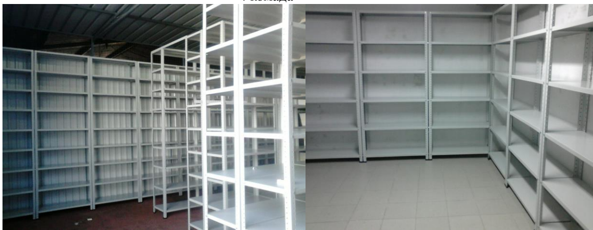
Слике 1 и 2: Изглед полица у простору